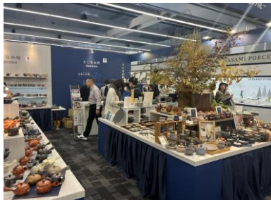
とこなめ焼ブース