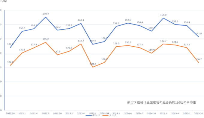
L P ガス 価格の推移 (2021.10~2025.10)

日本陶磁器工業協同組合連合会では、組合員事業所のLPガスの仕入れ価格を調査しており、今回の調査(9月仕入・10月支払)ではボンベ78社、ストレージタンク17社の結果が得られ平均値で142.8