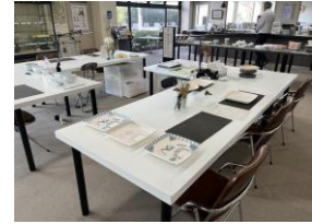
ワークショップ(絵付け体験)